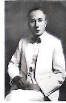
Tan Cheng Lock