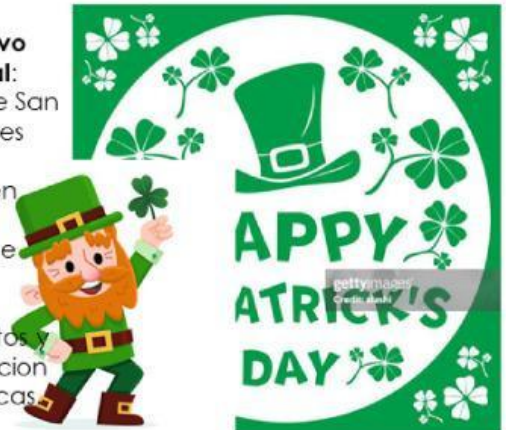
Imagen con fondo blanco

El Día de San Patricio es un día festivo en Irlanda, donde se realizan desfiles, conciertos y celebraciones públicas.