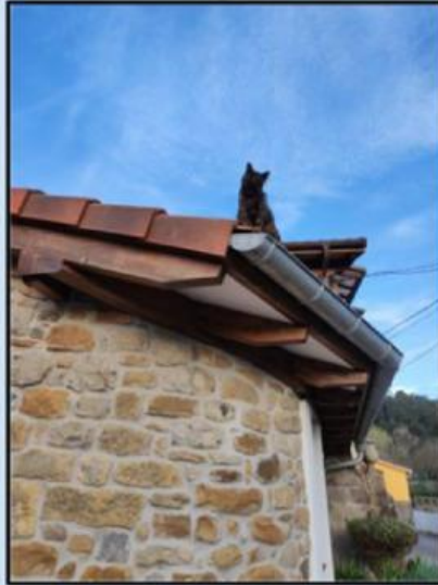
Pepa vigilando desde el tejado

Pepa es toda una reina del pueblo, todo el mundo pasea cerca de su casa para ver si está realizando sus funciones.