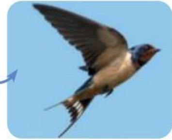
CONSUMIDOR SECUNDARIO (carnívoro)