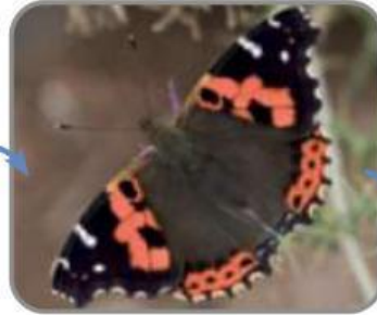
CONSUMIDOR PRIMARIO (herbívoro)