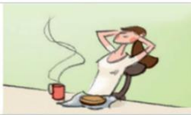
eine Pause machen