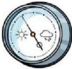
El Barómetro mide la presión atmosférica.