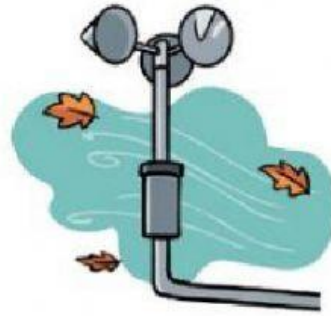
EL Anemómetro mide la velocidad del viento.