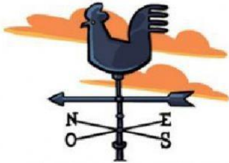
La Veleta muestra la dirección del viento. (N, S, E, O)