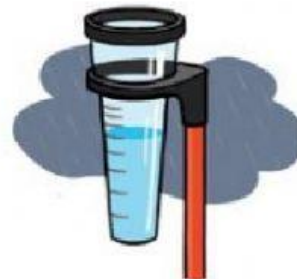
El Pluviómetro mide la cantidad de agua cuando llueve.