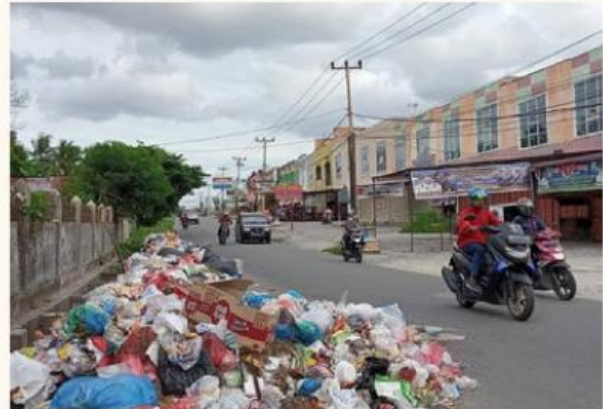
Gambar 4. Sampah di Pekanbaru

PEKANBARU (RIAUPOS.CO) - Kota Pekanbaru masih dihadapkan dengan persoalan serius mengenai sampah, yang berdampak pada tingginya tingkat pencemaran lingkungan. Kendati upaya penanganan telah dilakukan, tumpukan sampah masih menjadi pemandangan umum di beberapa jalan alternatif dan ruas jalan protokol.