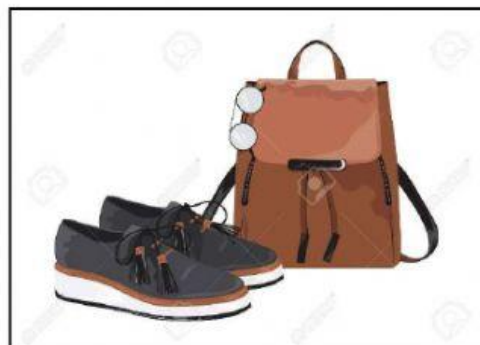
Document 1: Des chaussures et sac en cuir

La vache est un animal important pour les êtres humains. elle donne du lait et de la viande . La vache donne des autres utilités pour les êtres humains, sa peau est utilisée pour fabriquer des sacs à main et des chaussures en cuir .