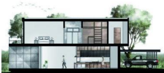
vista en corte