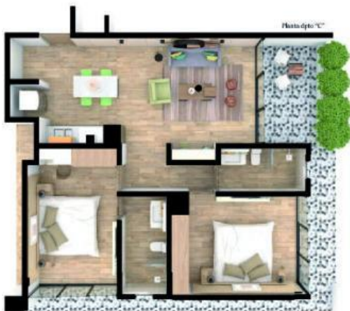
- plano Elegido