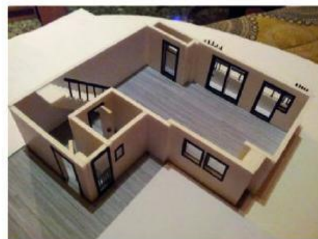
- material madera balsa