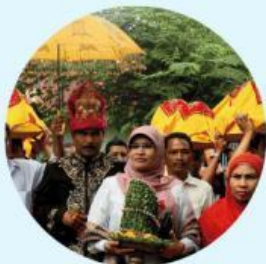
Intat linto baro di Aceh

Contoh adat-istiadat yang ada di lingkungan sekitar, yaitu: