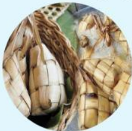
Memasak ketupat ketika hari raya

Contoh norma yang ada di lingkungan sekitar, yaitu: