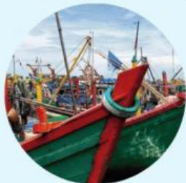
Larangan kelaut untuk nelayan Aceh selama 3 hari