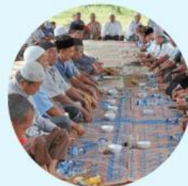
Kenduri laot di Aceh