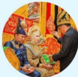
Peusijek di Aceh