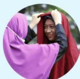
Wajib menutup aurat bagi kaum wanita