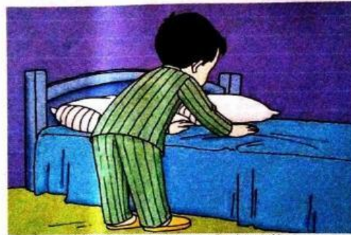
Gambar 9.8 Ahmad rajin merapikan kamar tidur

Kita harus menjaga kebersihan lingkungan. Setelah bangun tidur, kita membersihkan tempat tidur.