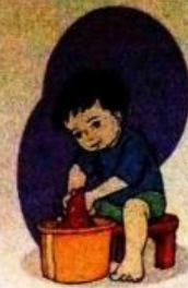
Gambar 9.7 Ahmad rajin mencuci baju

Pakaian yang kita pakai harus bersih. Pakaian kotor harus segera dicuci.