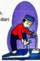
Gambar 9.12 Ahmad Membersihkan Najis dengan Air

Bersih dari najis atau hadas dinamakan suci. Kita harus menjaga kesucian dan kebersihan badan.