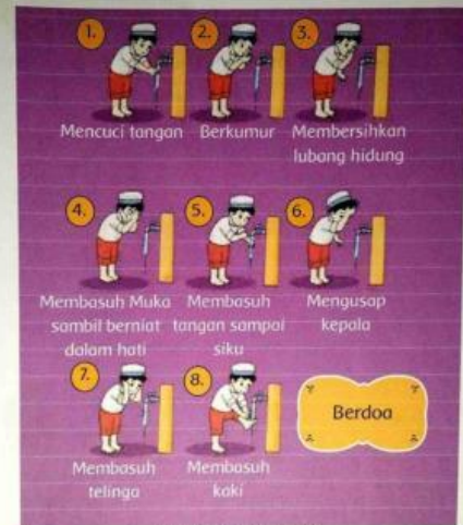
Gambar 9.15 Urutan berwudu