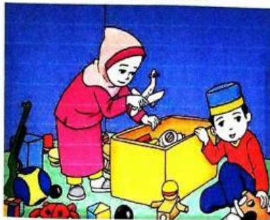
Gambar 9.9 Ahmad dan Fatimah merapikan mainan

Setelah bermain, kita harus merapkannya.