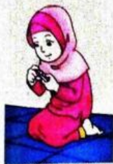
Gambar 9.4 Fatimah rajin memotong kuku

Kita bersihkan rambut dengan keramas secara rutin. Kuku yang panjang kita potong dan dibersihkan.