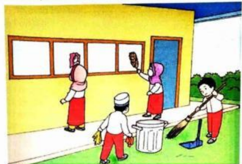
Gambar 9.11 Fatimah dan temannya membersihkan lingkungan sekolah

Setelah itu, kami mencuci tangan dengan sabun.