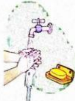
Gambar 9.5 Cuci tangan dengan sabun

Kita rajin mencuci tangan. Jangan lupa cuci tangan memakai sabun dan air yang mengalir.