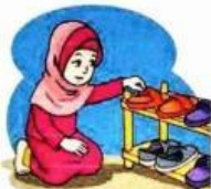
Gambar 9.10 Fatimah rajin merapikan sepatu dan sandal

Kita letakan sepatu dan sandal pada tempatnya. Hidup bersih menjauhkan kita dari penyakit.