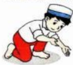
Gambar 9.17 Urutan bertayamum