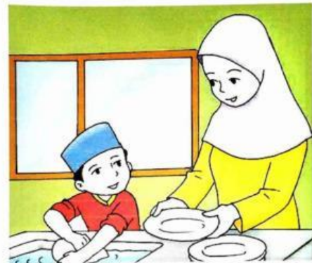
Gambar 9.19 Ahmad sedang membantu ibu mencuci piring