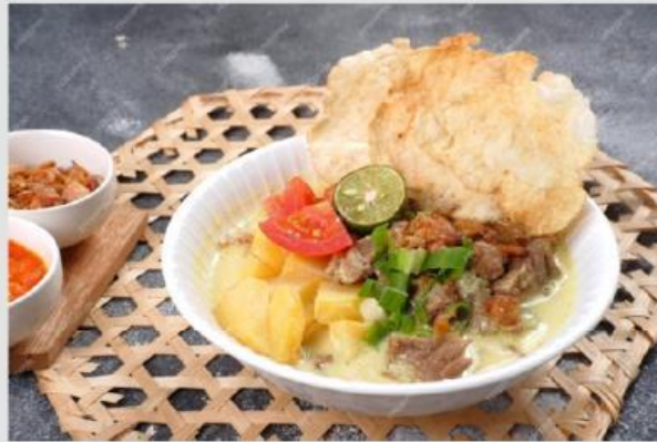
Gambar 3. Soto Betawi

Soto Betawi merupakan soto khas dari DKI Jakarta. Seperti soto lainnya, soto Betawi juga menggunakan jeroan. Selain jeroan, sering kali soto betawi menggunakan jeroan bagian lainnya seperti babat, kikil, dan lainnya. Daging sapi juga sering kali menjadi bahan campuran dalam soto Betawi. Kuah soto betawi merupakan campuran santan dan susu. Campuran inilah yang membuat rasa soto Betawi begitu khas dan legit. Pada proses pembuatan soto Betawi, daging yang digunakan dipotong dengan ukuran kecil dan tipis agar daging lebih cepat matang dan empuk.