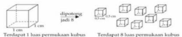
Gambar 2.3 Perbandingan luas kubus yang diperkecil