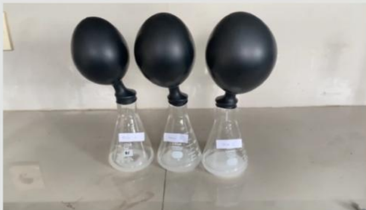
Gambar 1. Video percobaan pengaruh konsentrasi terhadap laju reaksi

Amatilah video percobaan mengenai faktor konsentrasi yang dapat mempengaruhi laju reaksi!