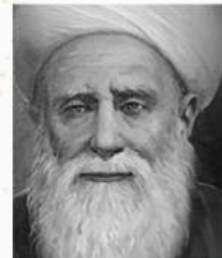
Imam Junaid Al baghdadi

Ajaran tentang pentingnya ma'rifat dan batin yang bersih