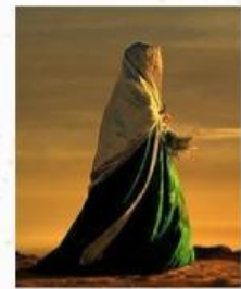
Rabi'ah Al adawiyah

Ajaran tentang pentingnya membersihkan hati dari sifat sifat tercela