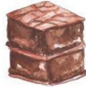
TARTA DE CHOCOLATE

2. ¿Qué pasa cuando el papá de Miki sube al barco pirata?