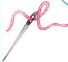
AGUJA E HILO