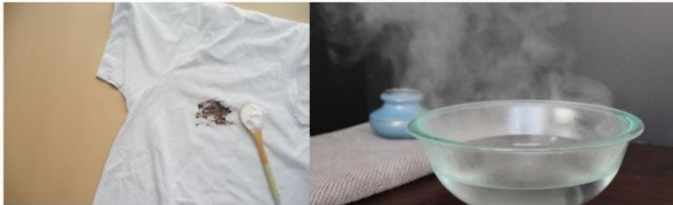
Gambar 1. Menghilangkan noda di baju dengan asam sitrat

Pernahkah kamu membersihkan noda pakaian dengan asam sitrat (citrin)? lebih cepat mana membersihkan noda dengan asam sitrat yang dicampur air biasa atau air panas? Tentu akan lebih cepat dengan air panas, bukan? Mengapa hal itu bisa terjadi? apa faktor yang mempengaruhinya?