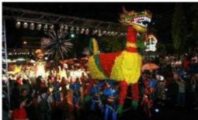
Gambar 1. Tradisi Dugderan