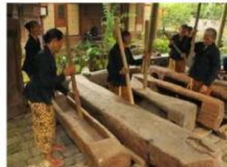
Gambar 2. Penumbukan Padi