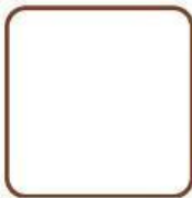
Lembar kerja 1