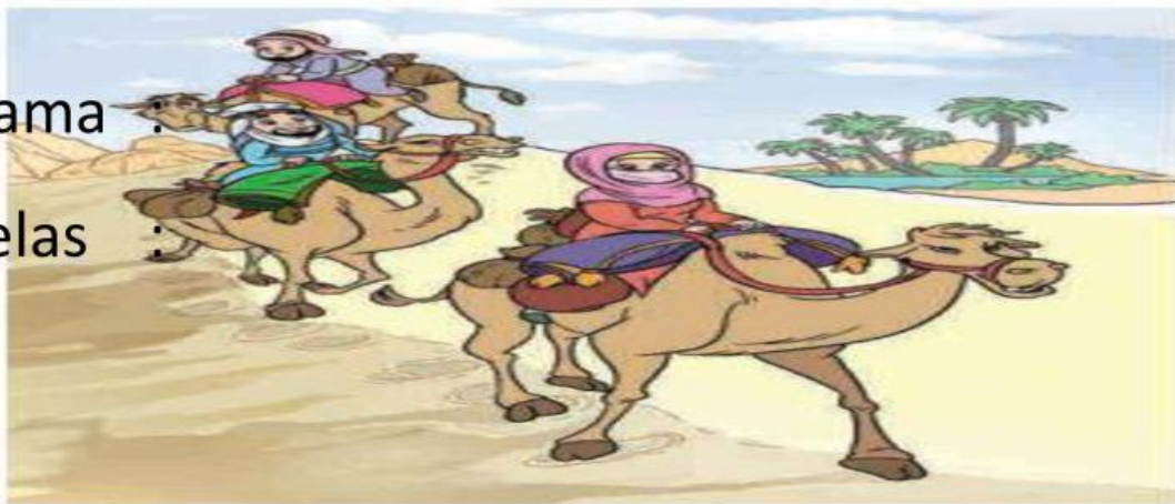
Gambar 5.2 Sahabat Nabi saw. dalam perjalanan hijrah