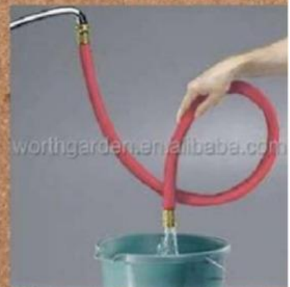
Gambar 1 : mengisi ember

Lalu apakah hubunganya antara memencet ujung selang dengan aliran fluida yang keluar ?