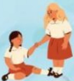
sasa membantu teman