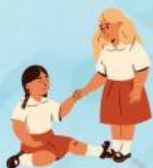
sasa membantu teman