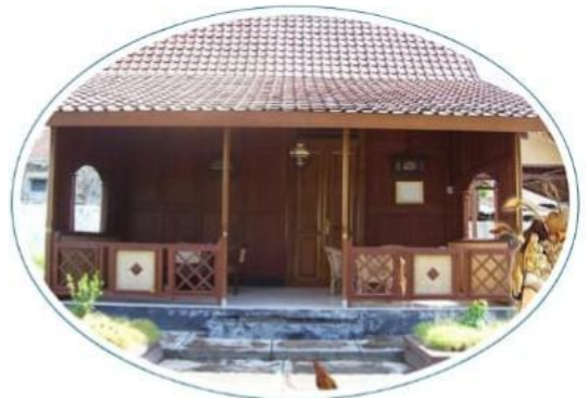
Gambar 2.2 Rumah Adat Suku Osing

Dapur ini menjadi tempat memasak dan menyimpan bahan makanan, sekaligus menunjukkan kesederhanaan dalam kehidupan sehari-hari.