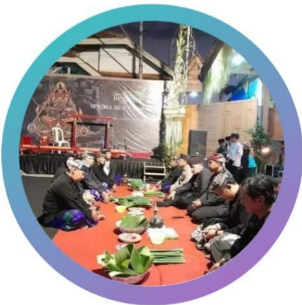
Gambar 1.3 Acara Bersih Desa Banyuwangi