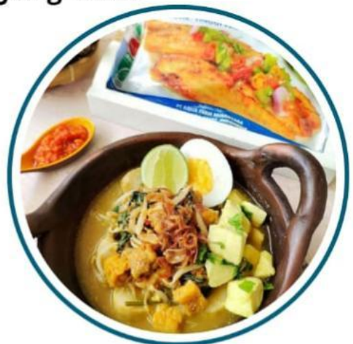
Gambar 3.2 Rujak Soto

Dari segi bahan-bahan, rujak soto juga memiliki makna mendalam. Misalnya, penggunaan cingur (bagian mulut sapi) melambangkan komunikasi dan hubungan sosial, sementara kuah soto yang hangat dan kaya rempah merepresentasikan kehangatan dan kekayaan budaya Banyuwangi. Filosofi ini mengajarkan pentingnya menjaga hubungan baik dengan sesama dan menghargai keberagaman budaya dalam kehidupan sehari-hari.