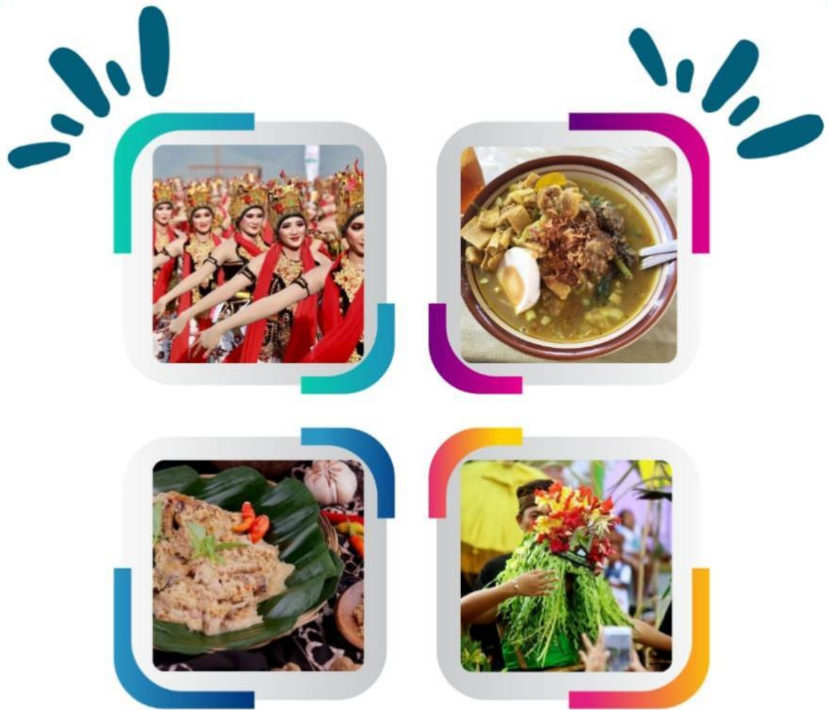
Gambar 1.2 Keberagaman Banyuwangi

Salah satunya adalah Tari Gandrung, sebuah tarian yang dibawakan sebagai bentuk rasa syukur kepada Tuhan atas hasil panen. Selain itu, ada Barong Ider Bumi, sebuah tradisi keliling desa untuk menolak bala. Masyarakat juga mengenal Tari Seblang yang hanya dibawakan oleh perempuan terpilih sebagai bagian dari upacara adat. Tidak ketinggalan, makanan khas daerah seperti Rujak Soto, Pecel Pitik, dan berbagai sajian tradisional lainnya menjadi bagian dari kekayaan budaya Banyuwangi. Semua ini menunjukkan betapa kaya dan beragamnya budaya di sekitar kita.