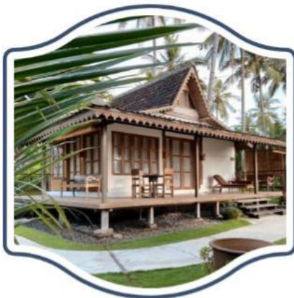
Gambar 2.1 Rumah Adat Suku Osing

Rumah adat Osing adalah salah satu kebanggaan masyarakat Banyuwangi, terutama suku Osing yang merupakan penduduk asli daerah ini. Rumah adat ini memiliki bentuk dan ciri khas yang unik, yang mencerminkan kearifan lokal serta kehidupan masyarakat yang sederhana namun penuh makna. Rumah adat Osing biasanya terbuat dari bahan-bahan alami seperti kayu, bambu, dan anyaman daun kelapa. Bentuk atapnya disebut tikel balung, yaitu berbentuk limas dengan sudut-sudut tajam yang khas.