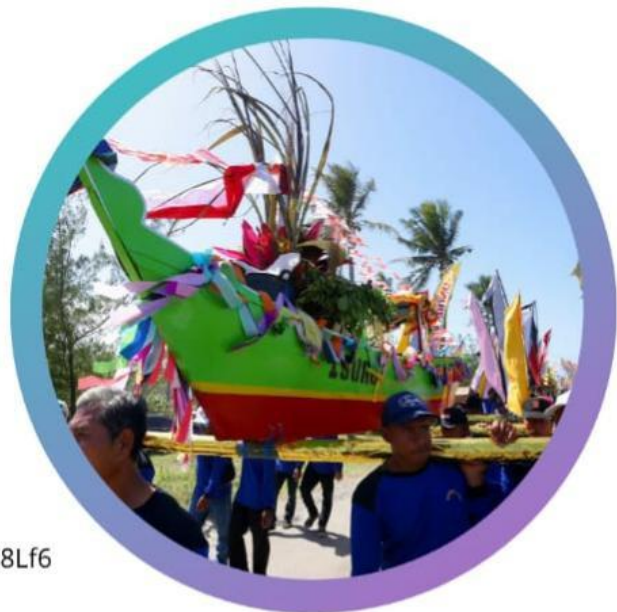
Gambar 1.4 Gotong Royong Acara Petik Laut