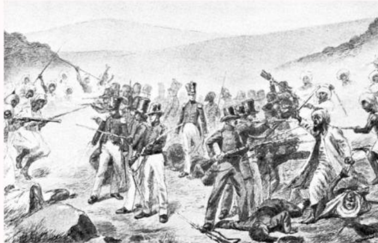
Gambar ilustrasi. Perjuangan Rakyat Nusantara Melawan Penjajahan Bangsa Eropa

Keserakahan bangsa Barat terhadap kekayaan Indonesia tidak hanya berujung pada monopoli perdagangan, tetapi juga kolonialisme yang menyebabkan penderitaan berkepanjangan. Namun, rakyat Indonesia tidak tinggal diam melihat negeri dan martabat mereka diinjak-injak oleh bangsa asing. Perjuangan meraih kemerdekaan memakan waktu yang lama dan mengorbankan banyak nyawa pahlawan yang rela berkorban demi tanah air tercinta.