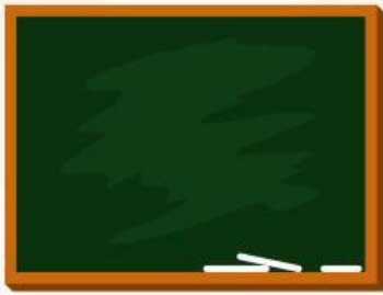
السَّبُّورَةُ (Papan tulis)