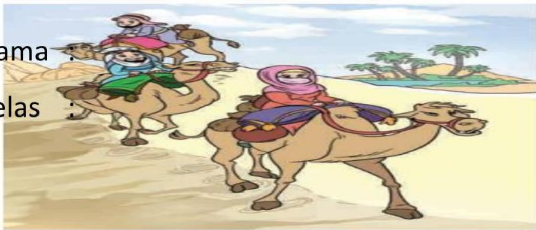
Gambar 5.2 Sahabat Nabi saw. dalam perjalanan hijrah