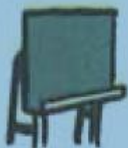
e. un tableau