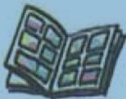
g. une BD