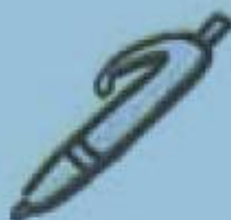
f. un stylo