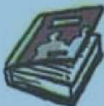
c. un livre