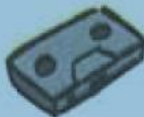
d. une cassette