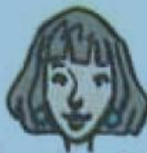
b. une fille