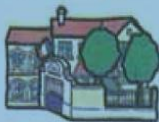
h. une école