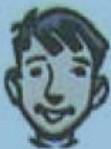
a. un garçon