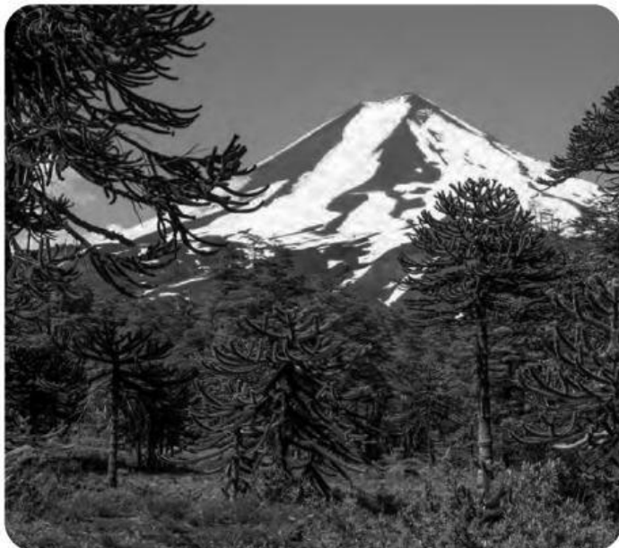
Parque Nacional Conguillio

Podemos cuidar este patrimonio, realizando acciones como: