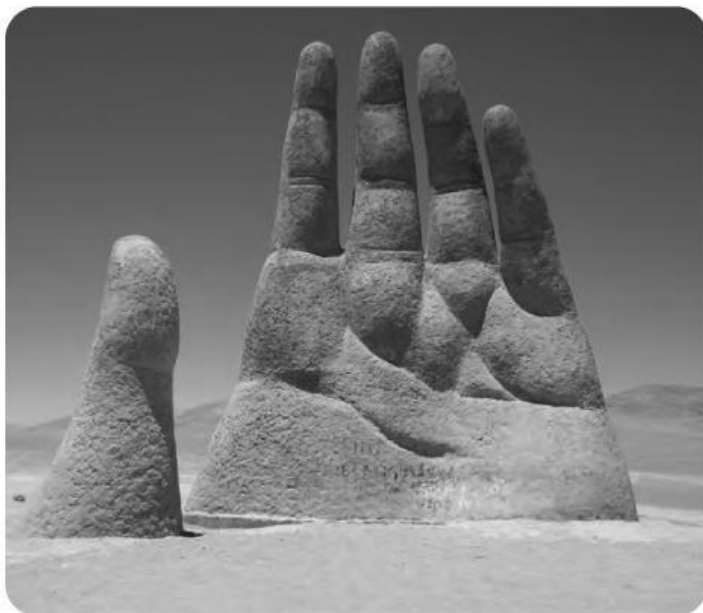
Monumento Mano del Desierto

Podemos cuidar este patrimonio, realizando acciones como: