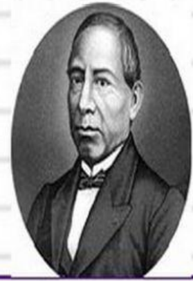
Presidente Benito Juárez (liberal)

La Guerra de Reforma concluyó con su triunfo.