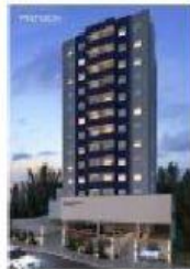
Prédio - apartamento