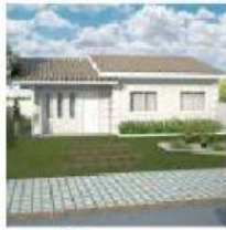
Casa – sobrado