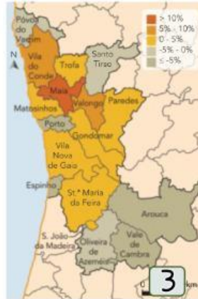
Área Metropolitana do Porto