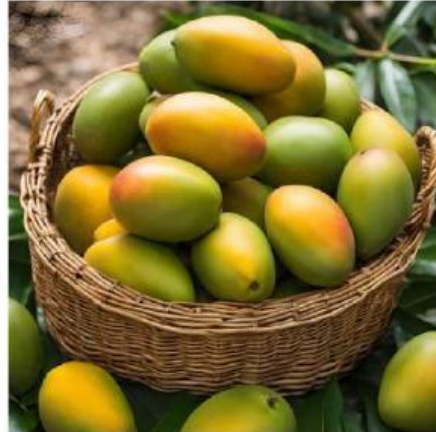
Toko B 0,75 Kg Rp 24.000

Toko mana yang kalian pilih untuk membeli mangga?