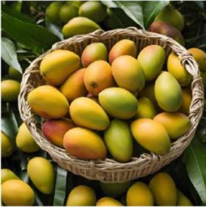
Toko A 1,6 Kg Rp 40.000

Toko A menjual paket mangga seharga Rp 40.000 untuk berat 1,6 kg. Toko B menjual mangga yang sama seharga Rp 24.000 untuk 0,75 kg.