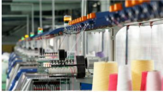
pabrik tekstil https://www.bing.com/images/search?

Sebuah pabrik tekstil hendak menyusun tabel aktiva mesin dan penyusutan mesin selama 1 tahun yang dinilai sama dengan 10 % dari harga perolehan sebagai berikut