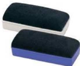
Penghapus papan tulis