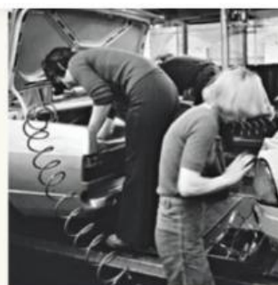
Arbeit im Motorraum 1981