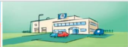
● Betrieb/ ● Firma