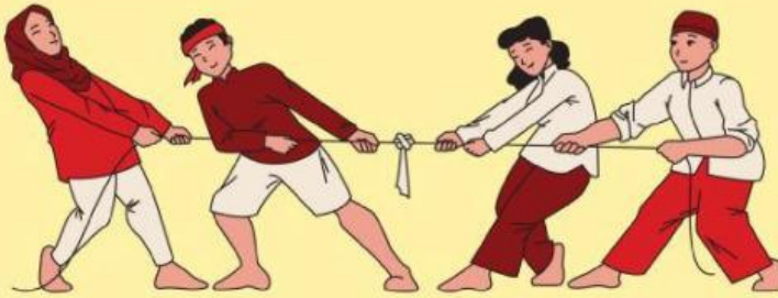
Gambar 3.14. Lomba Tarik Tambang

Pernahkah kalian mengikuti lomba tarik tambang? Tahukah kalian, pada perlombaan tarik tambang, setiap aksi pada tali dari penarik sebelah kanan selalu sama dengan reaksi ppada tali penarik sebelah kiri. Hal ini dibuktikan dengan tegangan tali yang merata dari kelompok sebelah kiri dan kelompok sebelah kanan. Jika gaya ini sama besar, menurut kalian bagaimana caranya agar perlombaan tarik tambang ini dapat dimenangkan oleh salah satu kelompok?