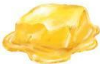
Mentega di panaskan