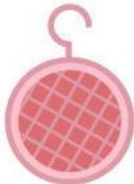
Kapur barus di lemari pakaian