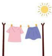
Pakaian di jemur