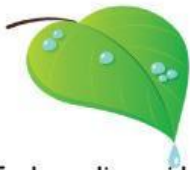
Embun di pagi hari