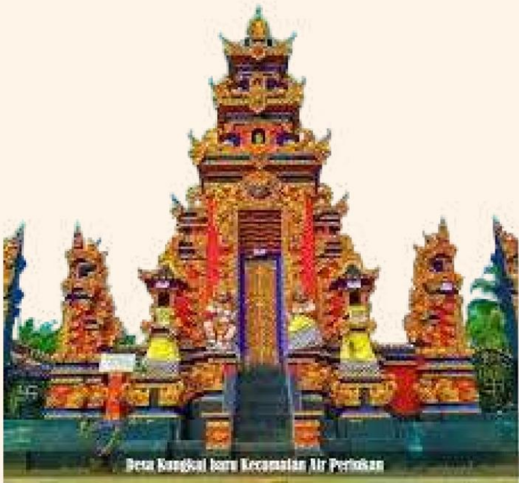
Pura Kungkai Baru Kecamatan Air Perindu

Di Provinsi Bengkulu , tepatnya di desa Kungkai Baru Kabupaten Seluma terdapat pura sebagai tempat ibadah umat Hindu. Pura ini bukan hanya tempat ibadah, tetapi juga menyimpan kearifan lokal yang memperkuat norma-norma agama dalam kehidupan sehari-hari. Pura memiliki banyak nilai luhur yang dapat kita pelajari, termasuk dalam hal bagaimana masyarakat di sekitarnya mematuhi norma-norma agama. Pura ini bukan hanya menjadi tempat berdoa, tetapi juga dijadikan sebagai pusat budaya .