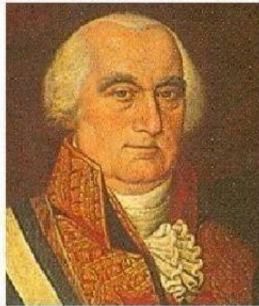
José Fernando de Abascal y Souza (Virrey del Perú).