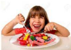
COMER MUCHAS GOLOSINAS