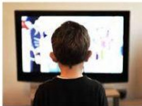
MIRAR TELEVISIÓN POR HORAS