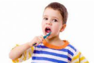
CEPILLARSE LOS DIENTES

HÁBITOS QUE PUEDEN PERJUDICAR NUESTRA SALUD