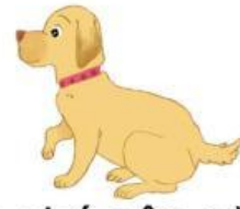
Con chó cân nặng