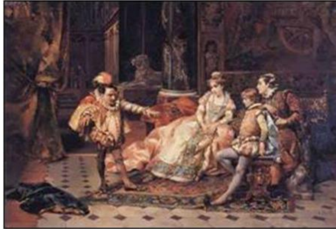
Detti (1833). El Bufón de la Corte cuadro en el que se encuentran 3 personas de la corte siendo divertidas por un persona que por su condición corporal "distinta" era utilizada para hacerlos reír en la edad media era llamado bufón.

El trabajo del bufón era igual al del trovador y al del juglar, pero la diferencia era que el bufón trabajaba en la corte.