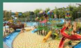
Wisata Royal Water Adventure