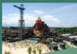
Wisata Pandawa Water Word