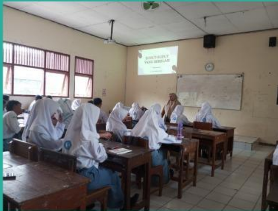
Gambar 1. Ruang Kelas

Coba kalian perhatikan susunan benda-benda yang ada di sekitar! Pernahkah kalian memperhatikan denah ruang kelasmu? Ada berapa baris meja siswa? Ada berapa kolom meja siswa?