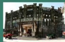
Wisata The Heritage Palace

Diketahui jumlah sumber daya manusia atau pegawai pada wisata-wisata di atas. Wisata Batu Seribu mempunyai pegawai laki-laki sebanyak 5 orang dan perempuan 1 orang. Wisata Makan Balakan mempunyai pegawai laki-laki 2 orang dan perempuan 1 orang. Wisata Pandawa Water Word mempunyai pegawai laki-laki 5 orang dan perempuan 5 orang. Wisata Royal Water Adventure mempunyai pegawai laki-laki sebanyak 5 orang dan perempuan 5 orang. Sedangkan untuk Wisata The Heritage Palace mempunyai pegawai laki-laki sebanyak 6 orang dan perempuan 4 orang.