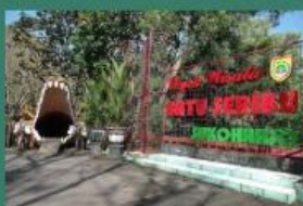
Wisata Batu Seribu