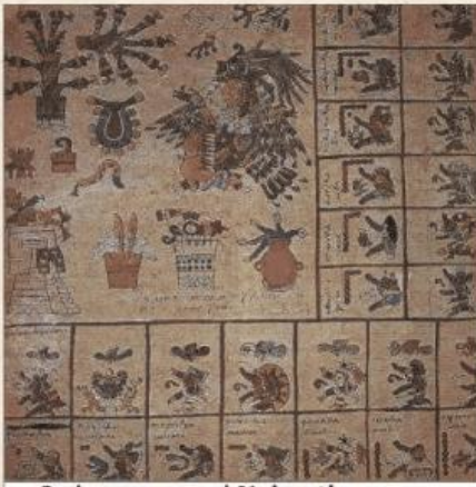
Su lengua era el Nahuatl.