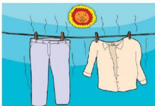
(Roupa secando no varal)

A partir dessas imagens, explique porque as duas situações estão ocorrendo.