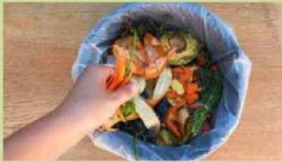
Gambar 1. Sampah makanan