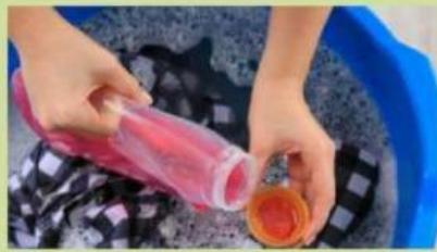
Gambar 2. Limbah deterjen rumah tangga