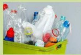
Gambar 3. Sampah plastik

Berdasarkan gambar 1, 2 dan 3 di atas, silahkan tulis rumusan masalah yang muncul di benak kalian setelah melihat gambar tersebut.