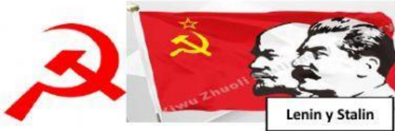
Lenin y Stalin

Las clases trabajadoras, que venden su fuerza por un salario para el sustento propio y el de sus familias.