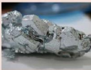
Gambar 1. Aluminium (Al)