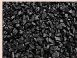
Gambar 2. Karbon(C)