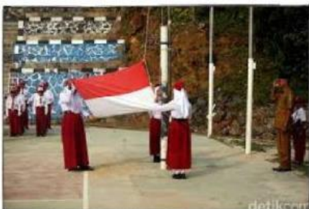
Gambar 3: Melaksanakan Upacara

Semboyan “Bhinneka Tunggal Ika” atau “berbeda-beda tapi tetap satu” adalah semboyan yang paling tepat untuk mendeskripsikan keberagaman Indonesia, sekaligus menunjukkan bahwa sila ketiga itu benar adanya. Mendeskripsikan karakter terbina bila terjadi persatuan antar rakyat Indonesia yang saling melengkapi dan saling membantu sebagai akibatnya terjadi kehidupan yang humanis, walaupun berbeda-beda namun tetap satu jua. Penerapan sila ketiga dilakukan dengan menjaga kerukunan dengan teman dan guru disekolah, Berteman tanpa memandang status sosial ekonomi, agama, suku, ras, dan golongan. menunjukkan rasa cinta tanah air dengan selalu mengikuti upacara bendera dengan tertib dan khidmat, Menghargai dan menghormati perbedaan, tidak melakukan hal-hal yang memicu pertengkaran, serta menjaga kebersihan lingkungan bersama warga sekolah.