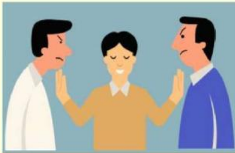
Gambar 2

Terlihat seseorang menengahi pertengkaran tersebut, hal bisa dikatakan mengurangi konflik dan ketegangan.