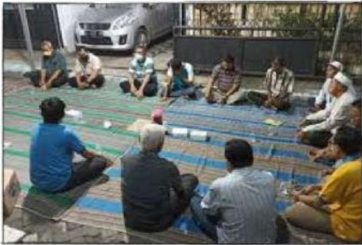
Gambar 5: Melakukan musyawarah

Hal ini menggambarkan masyarakat Indonesia harus mengutamakan musyawarah untuk menyelesaikan permasalahan atau saat membicarakan suatu hal. Dengan bermusyawarah, diharapkan masalah atau hal yang sedang dibicarakan dapat diselesaikan dengan baik tanpa harus menyebabkan konflik atau masalah lebih lanjut. Penerapan nilai sila keempat dilakukan dengan tidak memaksakan pendapat dan kehendak kepada teman, mendengarkan pendapat orang lain, mengambil keputusan untuk kepentingan bersama lewat jalan musyawarah. mengutamakan kepentingan bersama di atas kepentingan pribadi, serta mempertanggungjawabkan keputusan yang diambil.