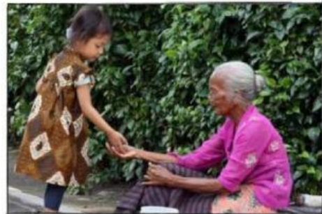
Gambar 2: Sikap kemanusiaan yang beradab