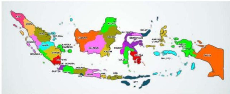
Gambar 1: Peta Indonesia