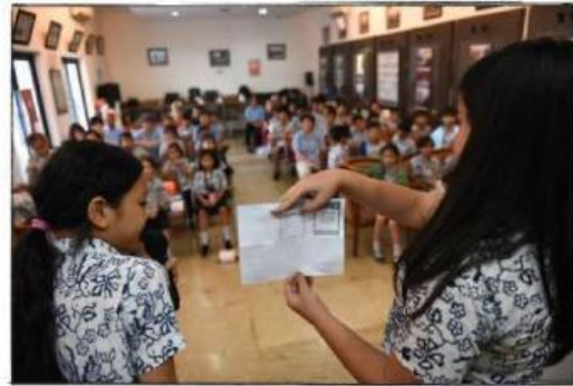
Gambar 6: Memberikan pendapat dan mendengarkan pendapat teman sekelas