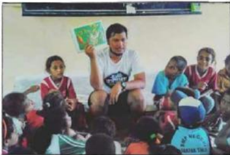
Gambar 1: Mengajar tanpa membeda-bedakan

Mengandung makna bahwa kemanusiaan haruslah diutamakan dalam aktivitas keseharian masyarakat Indonesia. Terlebih lagi negeri ini berdiri di atas berbagai macam perbedaan, seperti yang tersurat dalam semboyan negara Indonesia, “Bhinneka Tunggal Ika”. Nilai kemanusiaan menjamin kita untuk memperlakukan sesama manusia dengan adil tanpa membedakan suku, ras, golongan, dan agama. Perbedaan ini harus selalu didukung dengan sikap kemanusiaan yang penuh dengan kasih sayang dan moral.