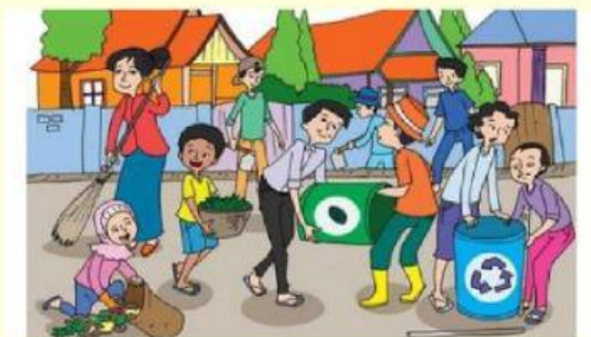
Gambar 3

Suasana kebersamaan untuk menciptakan kenyamanan bersama.