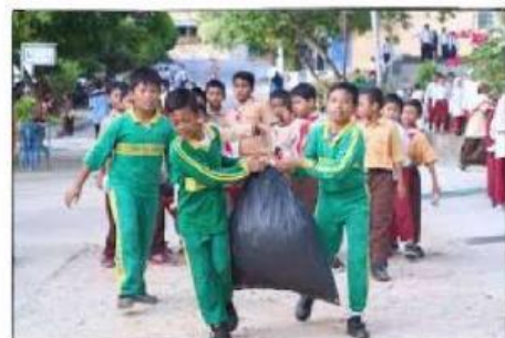
Gambar 4: Melakukan Gotong-royong