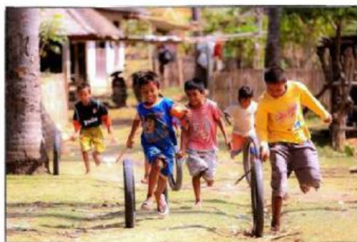
Gambar 7: Bermain tanpa membedakan

Peserta didik dapat menjunjung tinggi persamaan hak untuk semua individu tanpa memandang perbedaan jenis kelamin, suku, agama, ras, atau latar belakang sosial ekonomi. Mereka dapat memperlakukan semua orang dengan adil dan memberikan kesempatan yang sama kepada semua.