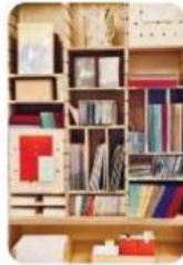
Gambar 4.1.3 Lemari Buku