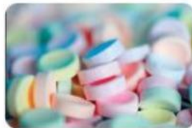
Gambar 4.1.1 Permen

Bahkan dari benda-benda yang biasa kamu lihat sehari-hari.