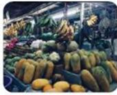
Gambar 4.1.4 Lapak Penjual Buah