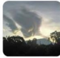
Gambar 4.1.5 Pemandangan Pancawati, Bogor

Kamu bisa membuat kreasi dari apa yang kamu amati.