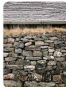
Gambar 4.1.2 Dinding Batu